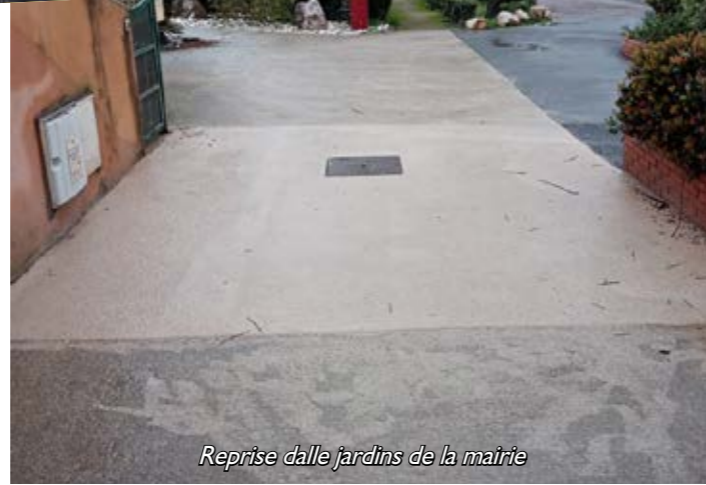
Reprise dalle jardins de la mairie