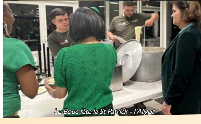
Le Bouc fête la St Patrick - l'Algot