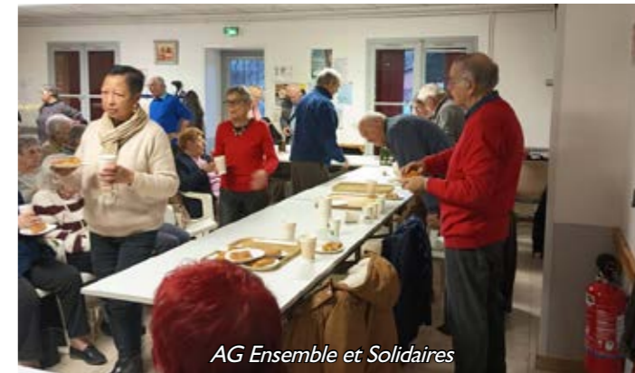
AG Ensemble et Solidaires