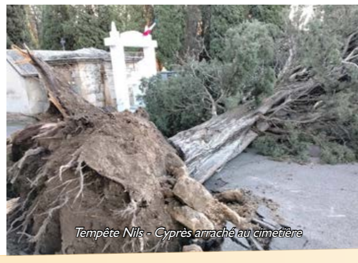
Tempête Nils - Cyprès arraché au cimetière