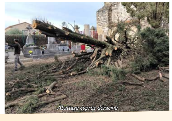
Abattage cyprès déraciné