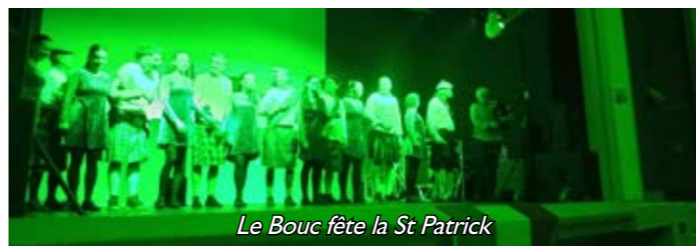
Le Bouc fête la St Patrick