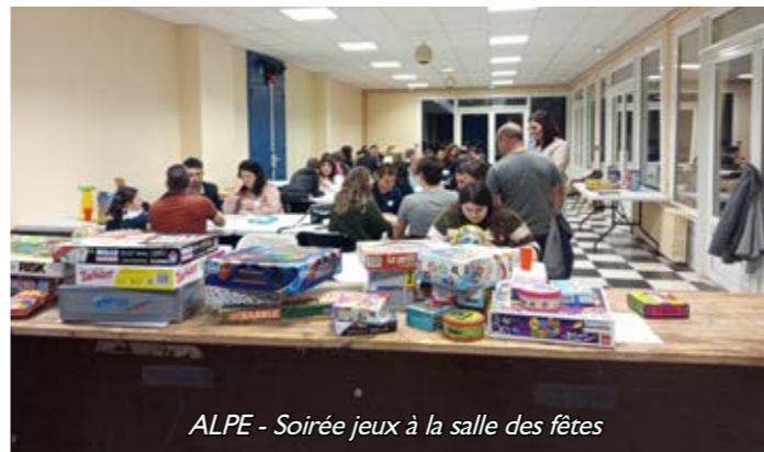
ALPE - Soirée jeux à la salle des fêtes