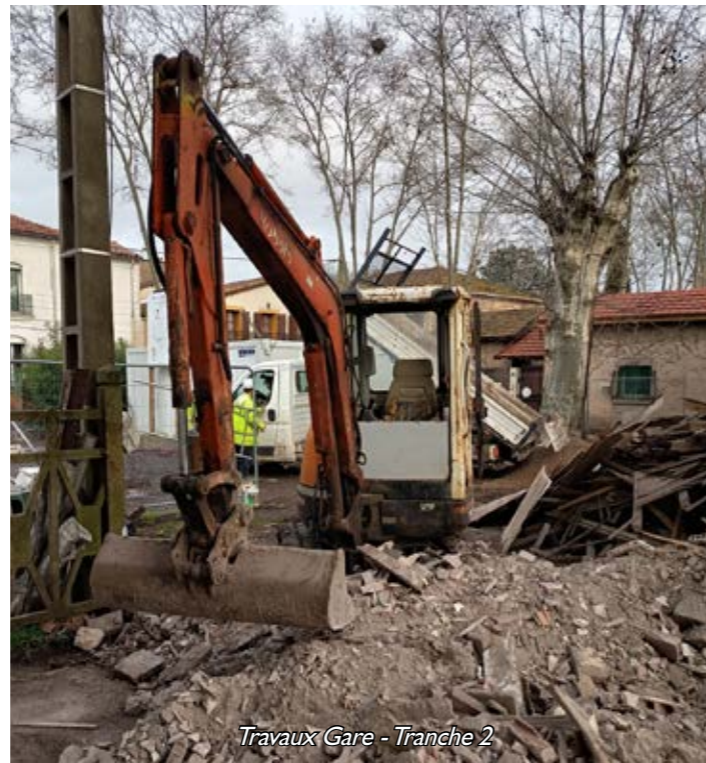
Travaux Gare - Tranche 2