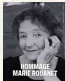
L'équipe DES AMIS DE PAULHAN

Joli printemps à tous et au plaisir de se retrouver.