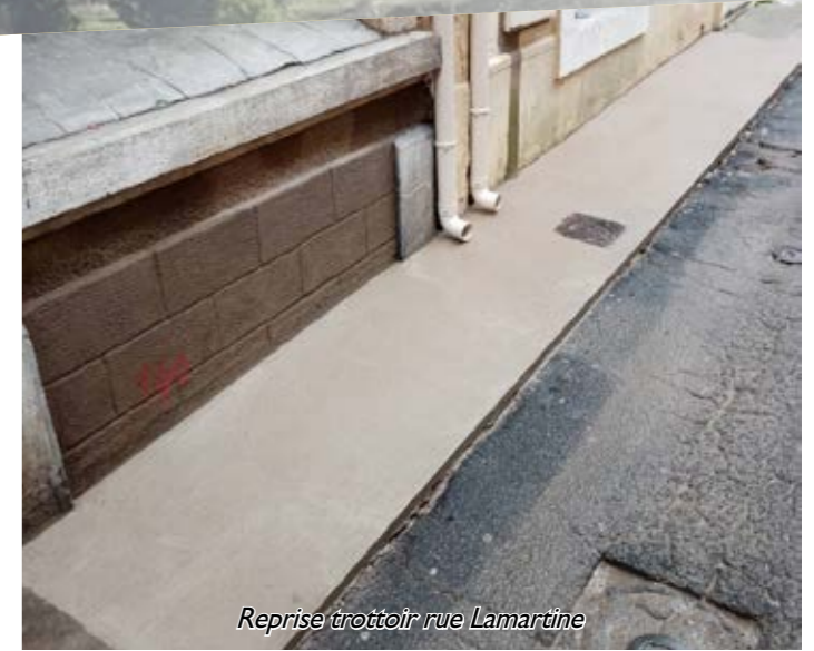
Reprise trottoir rue Lamartine