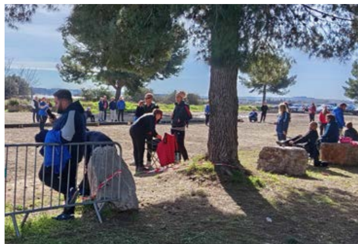
Epreuve qualificative - championnat de l'Hérault tête à tête masculin et féminin - Pétanque