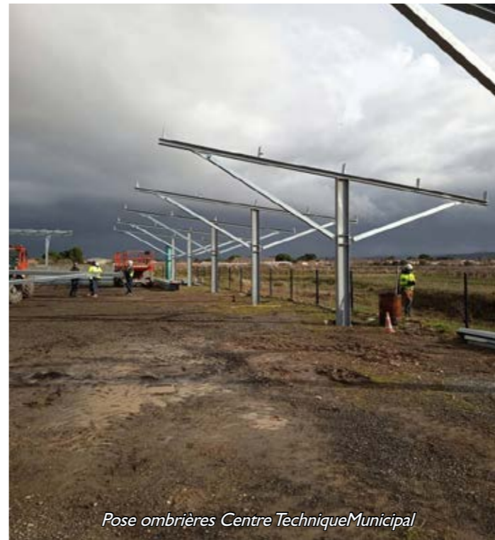
Pose ombrières Centre Technique Municipal