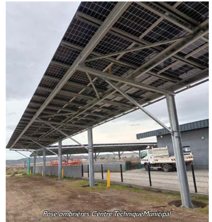
Pose ombrières Centre Technique Municipal