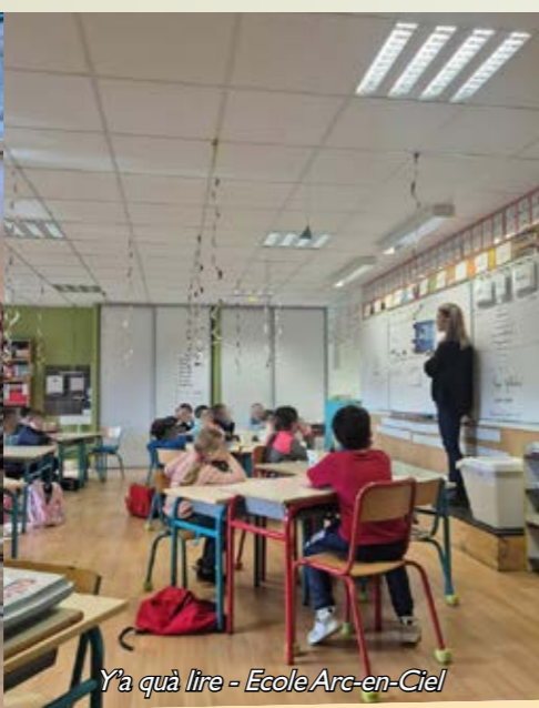
Y'a qu'à lire - Ecole Arc-en-Ciel