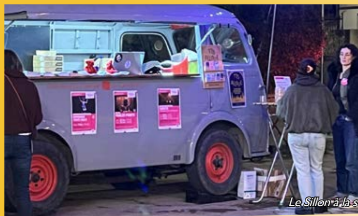
Le Sillon à la salle des fêtes