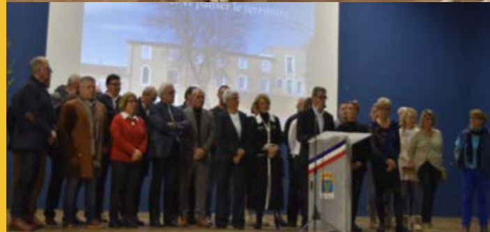
Cérémonie des vœux 2026