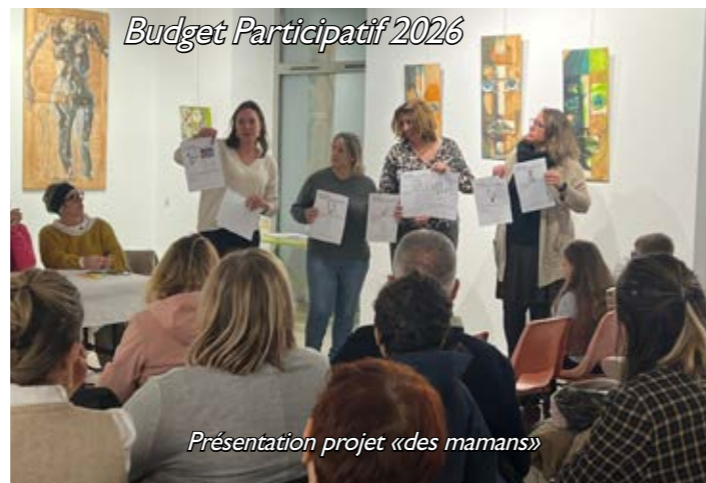
Budget Participatif 2026