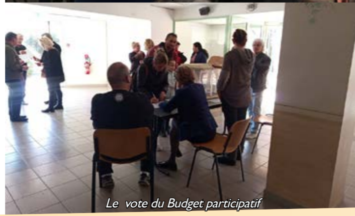
Le vote du Budget participatif