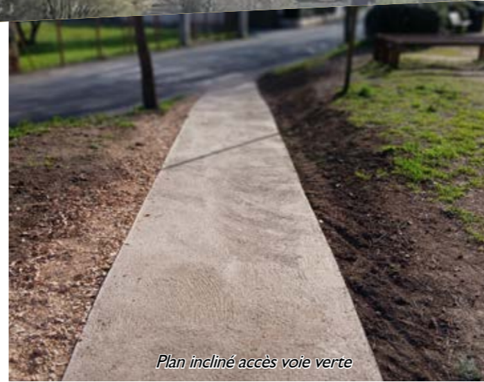
Plan incliné accès voie verte