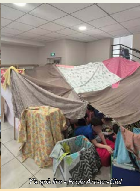
Y'a qu'à lire - Ecole Arc-en-Ciel