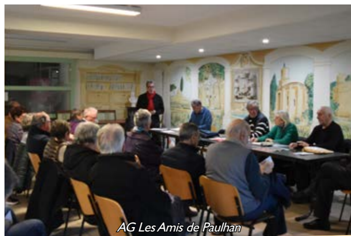
AG Les Amis de Paulhan