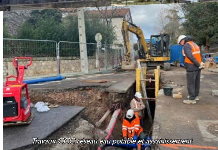
Travaux CCC réseau eau potable et assainissement