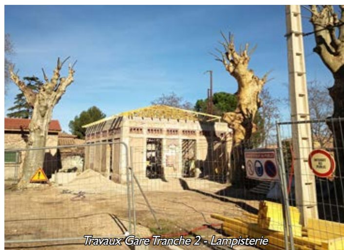
Travaux Gare Tranche 2 - Lampisterie