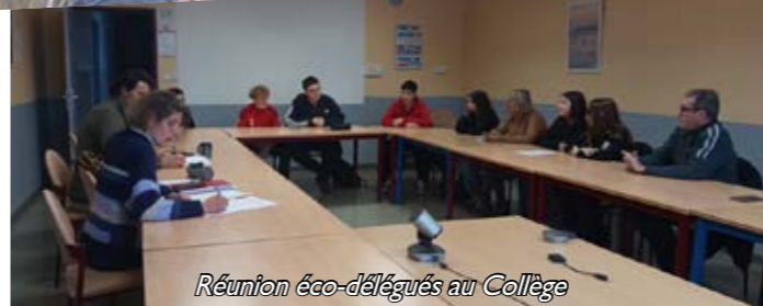
Réunion éco-délégués au Collège