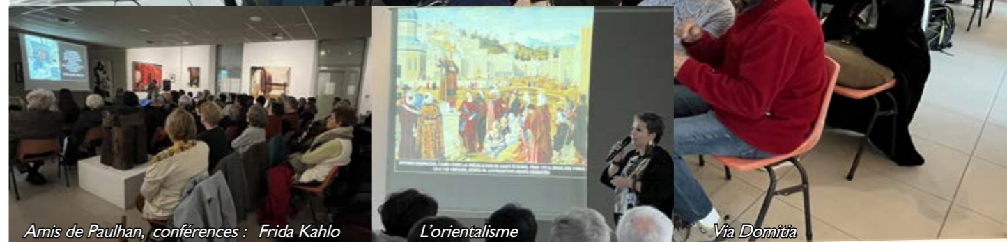
Amis de Paulhan, conférences : Frida Kahlo