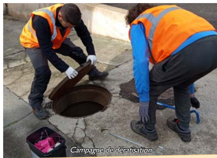
Campagne de dératisation