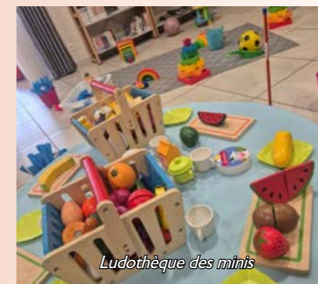
Ludothèque des minis