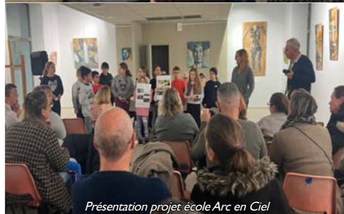
Présentation projet école Arc en Ciel