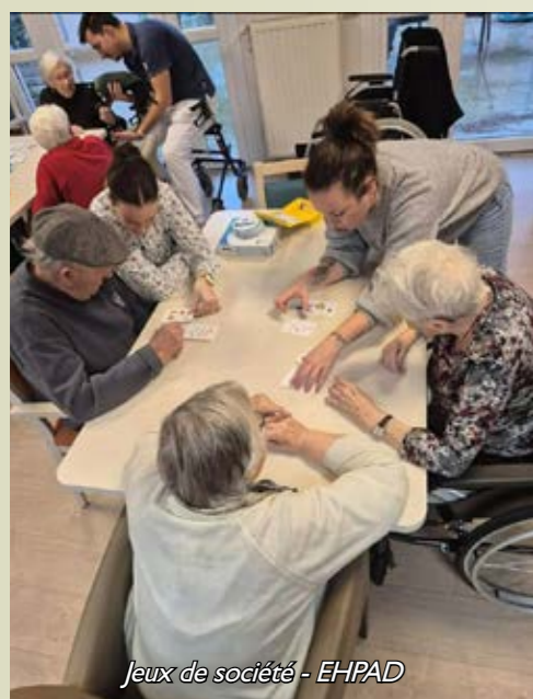
Jeux de société - EHPAD