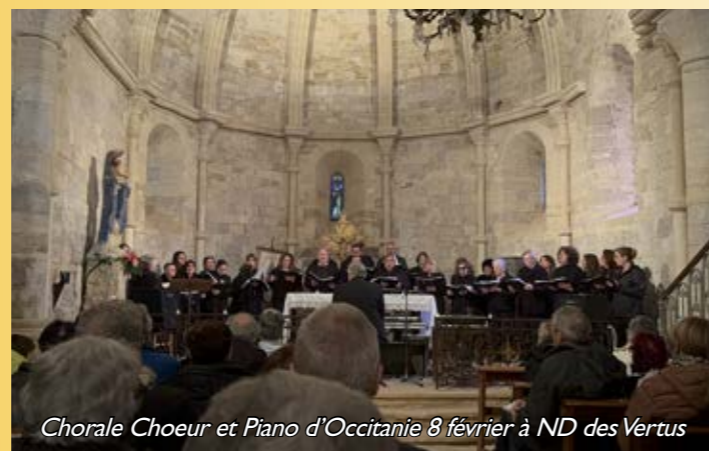
Chorale Choeur et Piano d'Occitanie 8 février à ND des Vertus