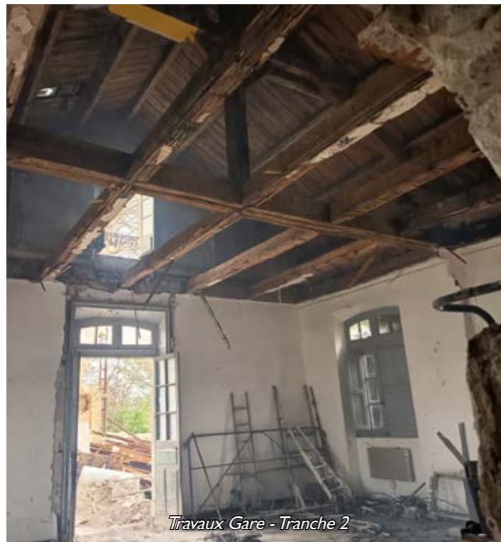
Travaux Gare - Tranche 2