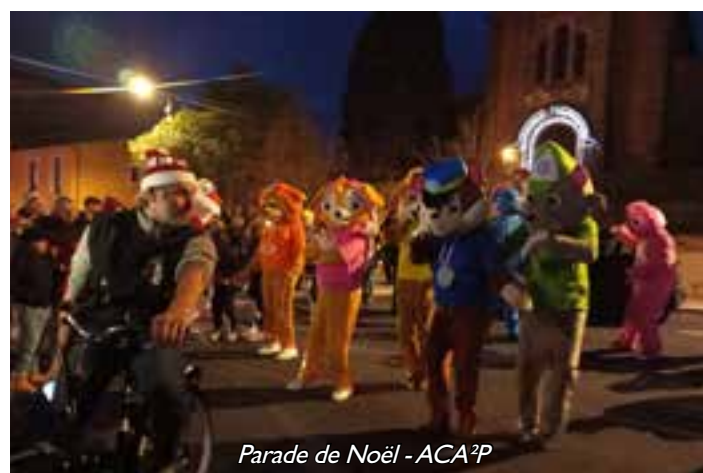
Parade de Noël - ACA³P