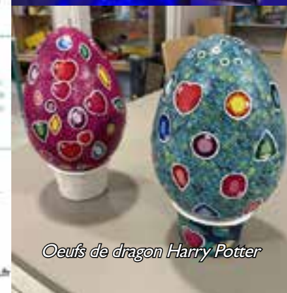
Oeufs de dragon Harry Potter