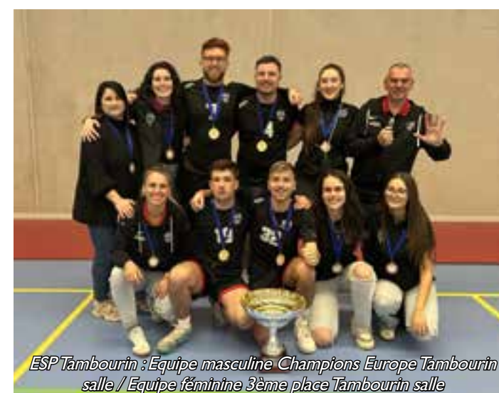
ESP Tambourin : Equipe masculine Champions Europe Tambourin salle / Equipe féminine 3ème place Tambourin salle