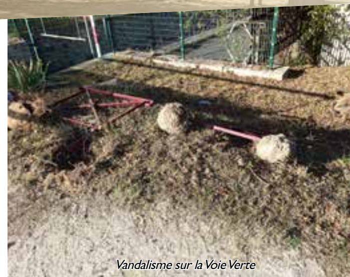
Vandalisme sur la Voie Verte