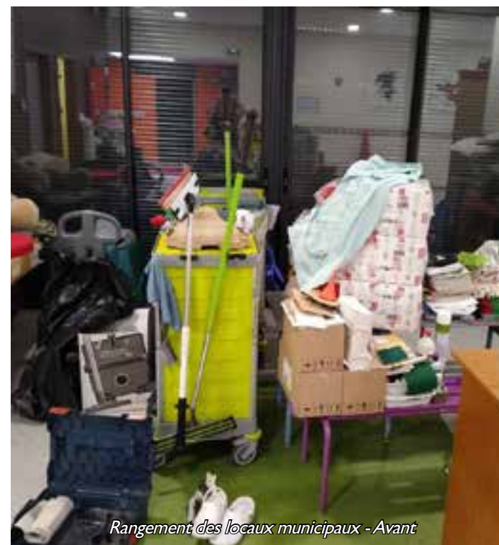
Rangement des locaux municipaux - Avant