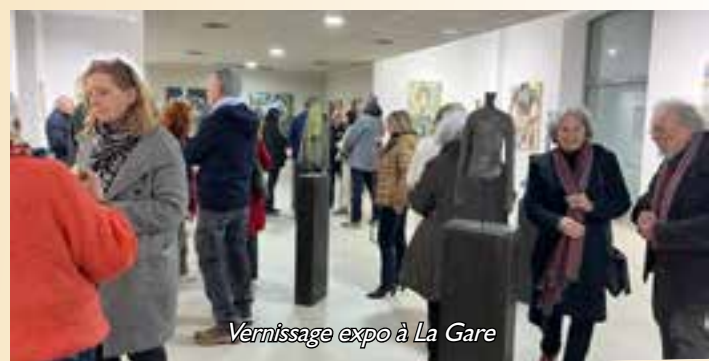
Vernissage expo à La Gare