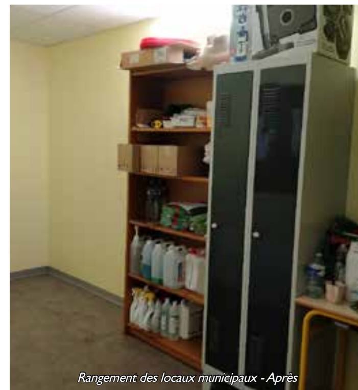
Rangement des locaux municipaux - Après