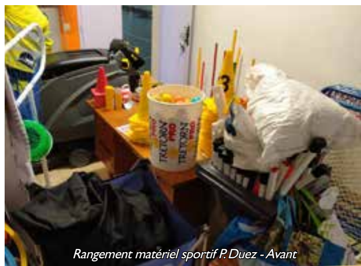
Rangement matériel sportif P. Duez - Avant