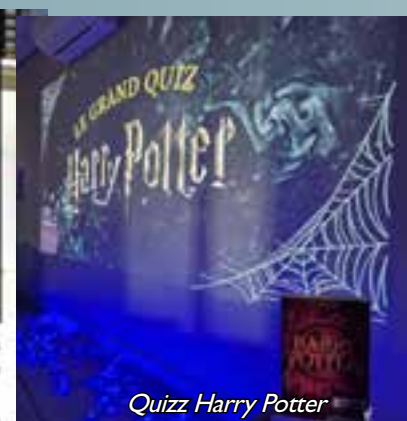
Quizz Harry Potter