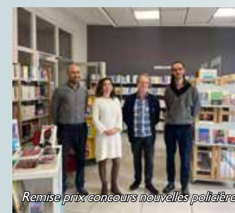
Remise prix concours nouvelles poétaires