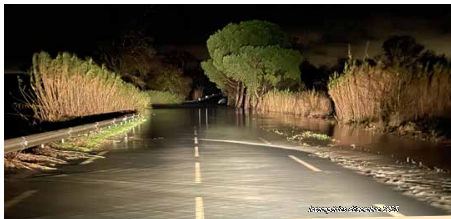
Intempéries décembre 2025