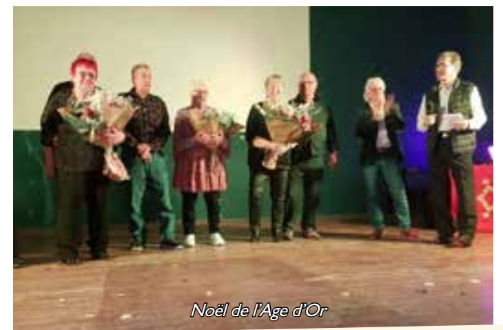
Noël de l'Age d'Or