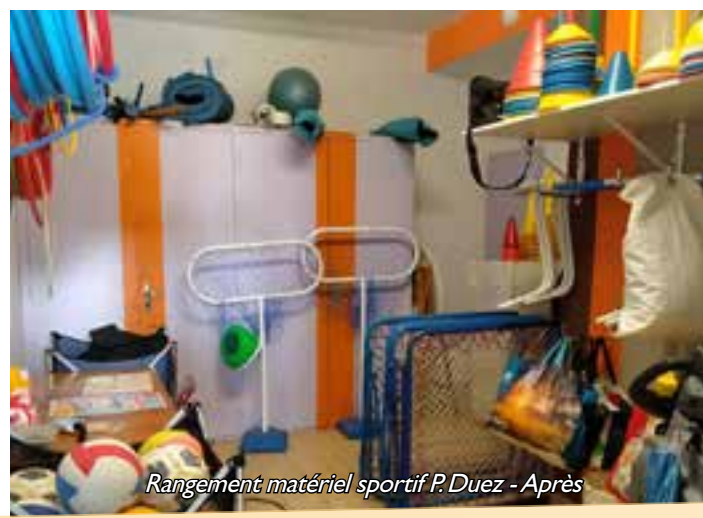
Rangement matériel sportif P. Duez - Après