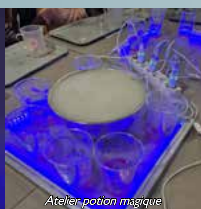
Atelier potion magique