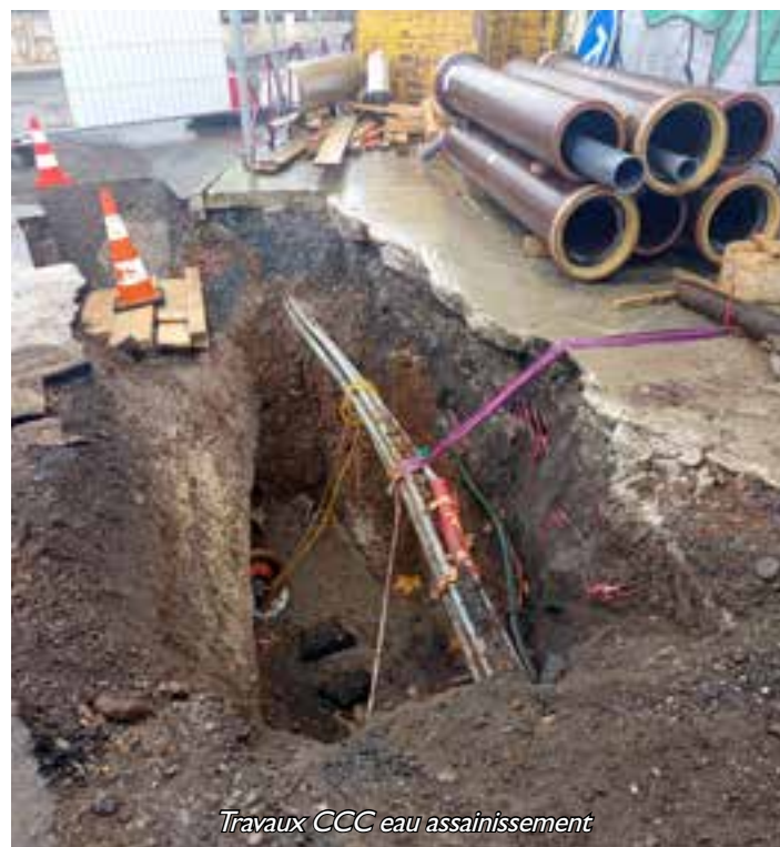
Travaux CCC eau assainissement