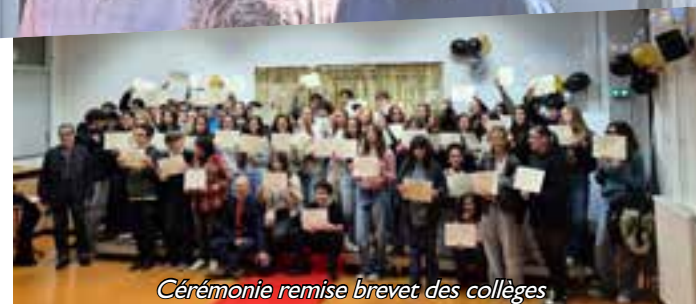
Cérémonie remise brevet des collèges