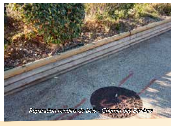
Réparation rondins de bois - Chemin des Ecoliers