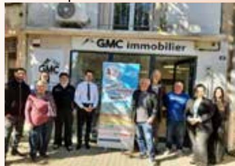
Photo avec notre partenaire GMC qui a obtenu le Label 2025 de la Fédération Départementale du Secours Populaire de l'Hérault le 3 Novembre 2025.

Cette période difficile pour tous mérite une attention particulière. « Tout ce qui est humain est notre ».