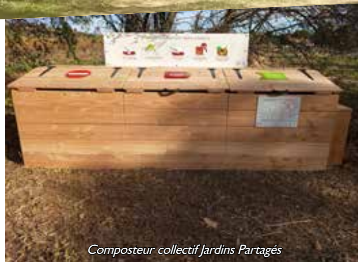
Composteur collectif Jardins Partagés