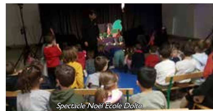
Spectacle Noël Ecole Dolto