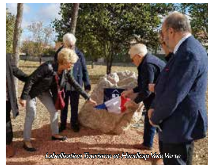
Labellisation Tourisme et Handicap Voie Verte