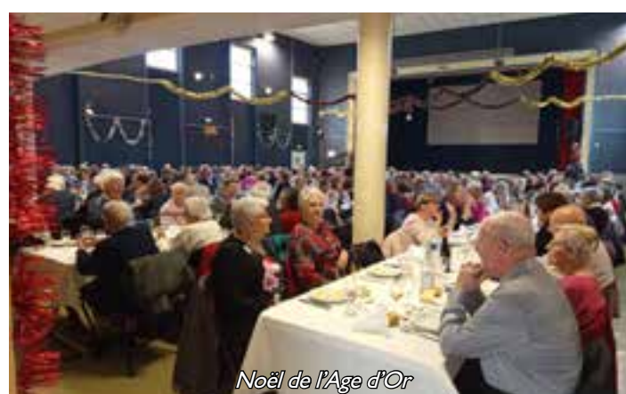
Noël de l'Age d'Or