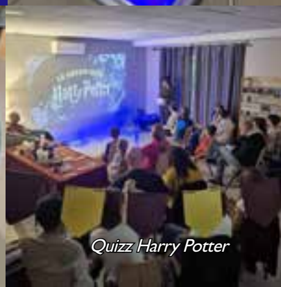
Quizz Harry Potter