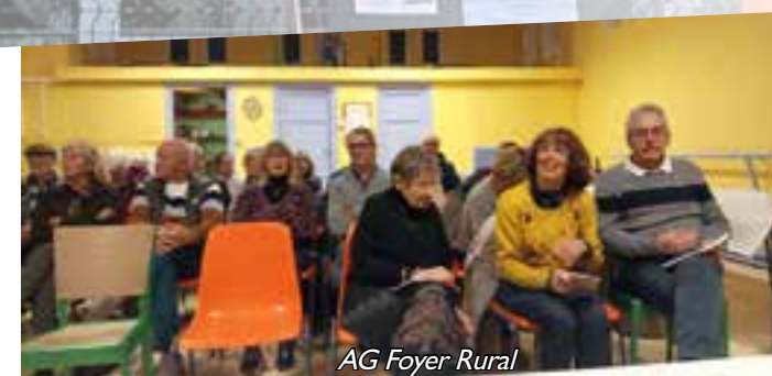
AG Foyer Rural