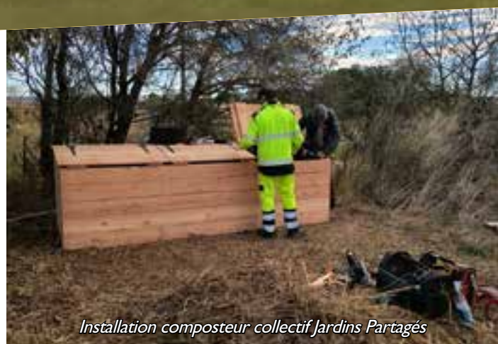
Installation composteur collectif Jardins Partagés