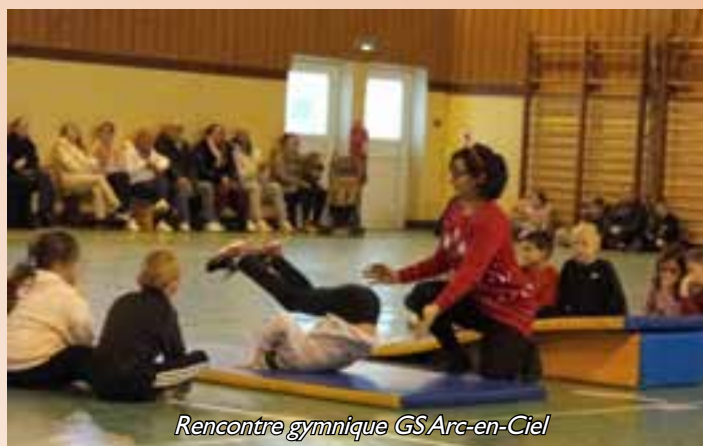
Rencontre gymnique GS Arc-en-Ciel