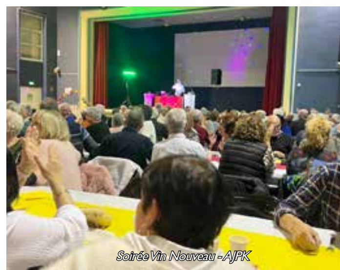
Soirée Vin Nouveau - AJPK