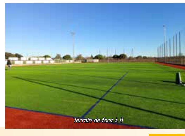
Terrain de foot à 8