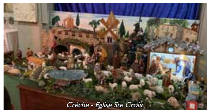
Crèche - Eglise Ste Croix