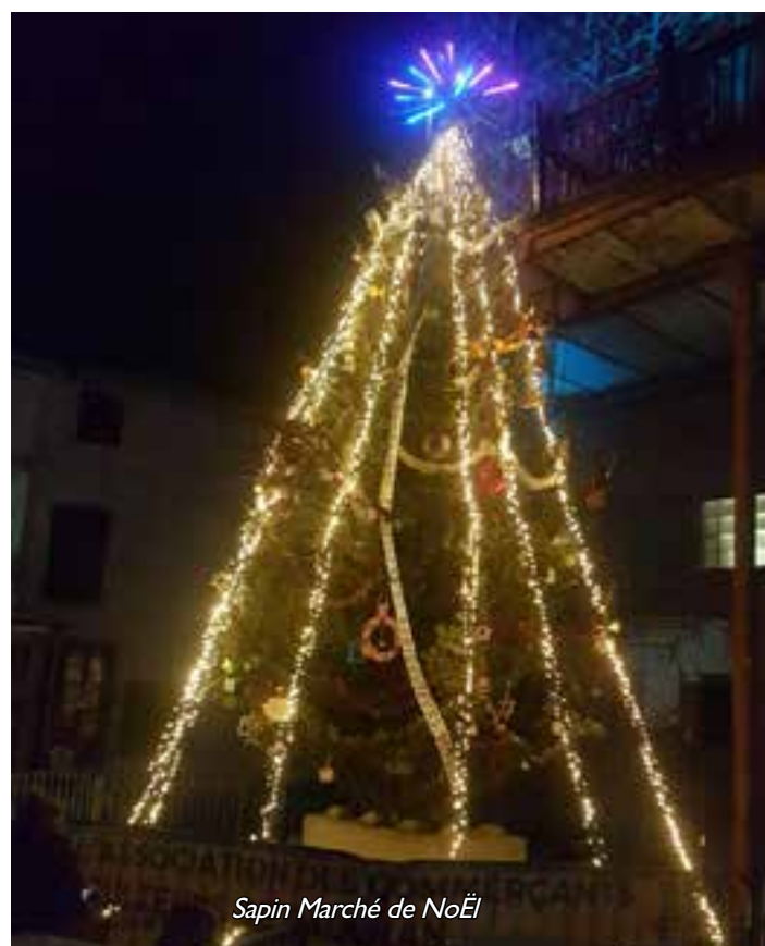
Sapin Marché de Noël