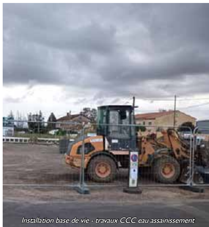
Installation base de vie - travaux CCC eau assainissement