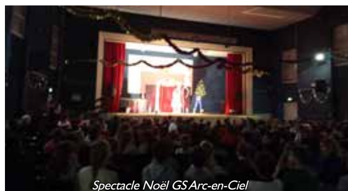
Spectacle Noël GS Arc-en-Ciel