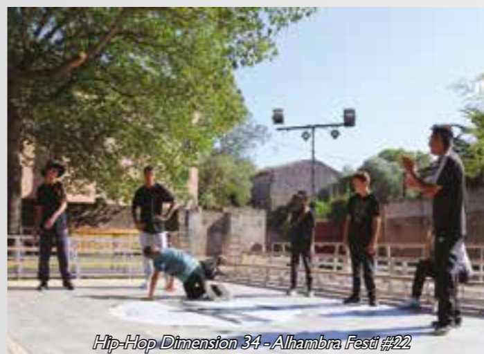
Hip-Hop Dimension 34 - Alhambra Festi #22