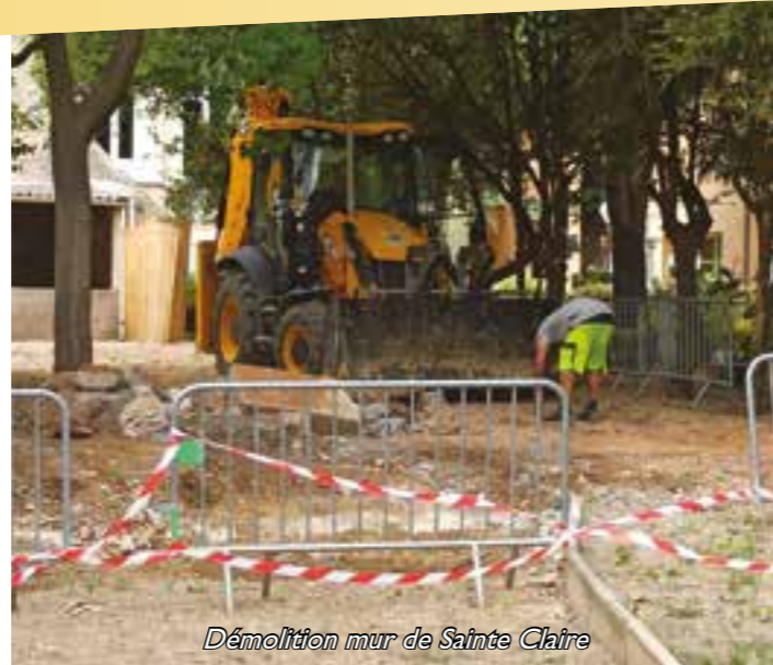
Démolition mur de Sainte Claire