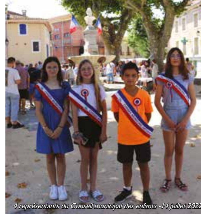
4 représentants du Conseil municipal des enfants - 14 juillet 2022