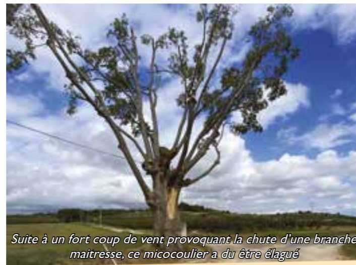
Suite à un fort coup de vent provoquant la chute d'une branche maitresse, ce micocoulier a du être élagué