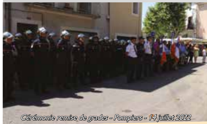
Cérémonie remise de grades - Pompiers - 14 juillet 2022