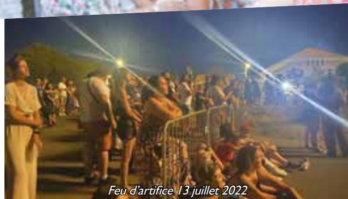
Feu d'artifice 13 juillet 2022