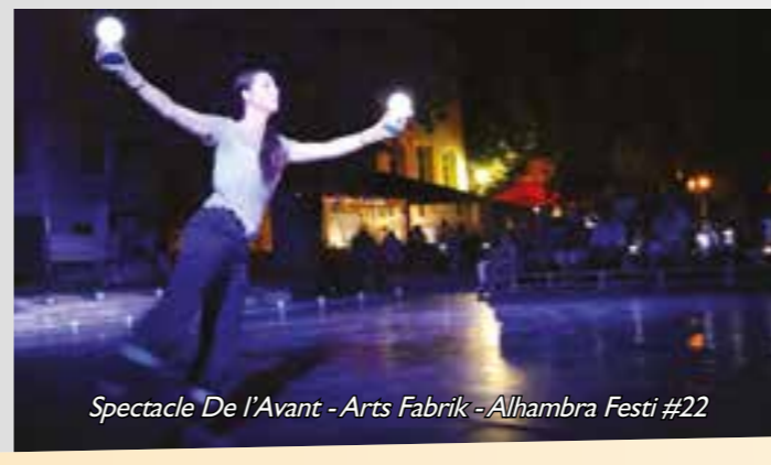
Spectacle De l'Avant - Arts Fabrik - Alhambra Festi #22