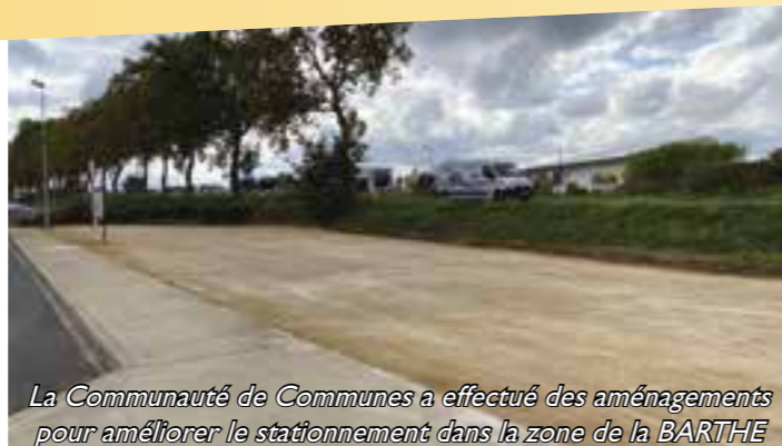
La Communauté de Communes a effectué des aménagements pour améliorer le stationnement dans la zone de la BARTHE