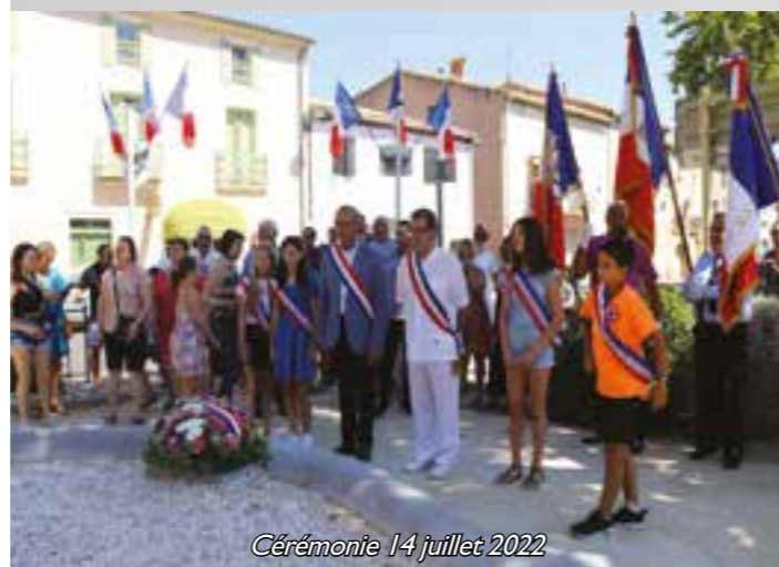
Cérémonie 14 juillet 2022