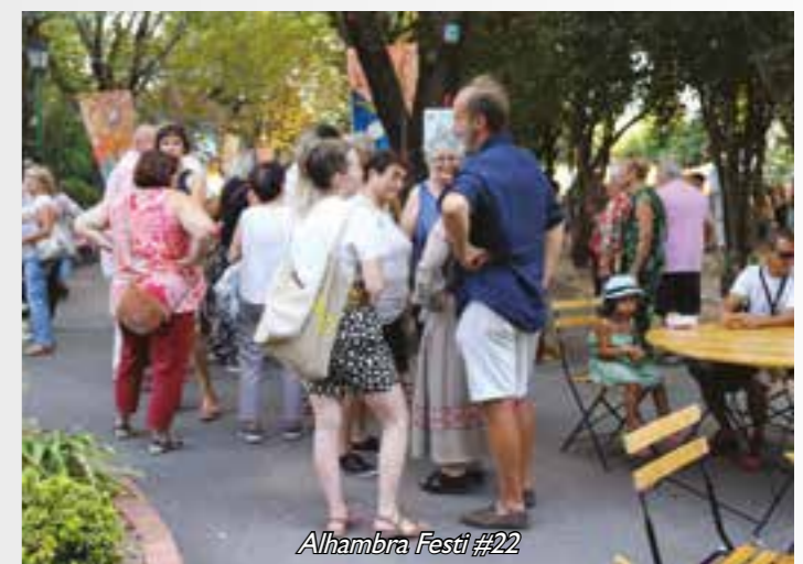
Alhambra Festi #22