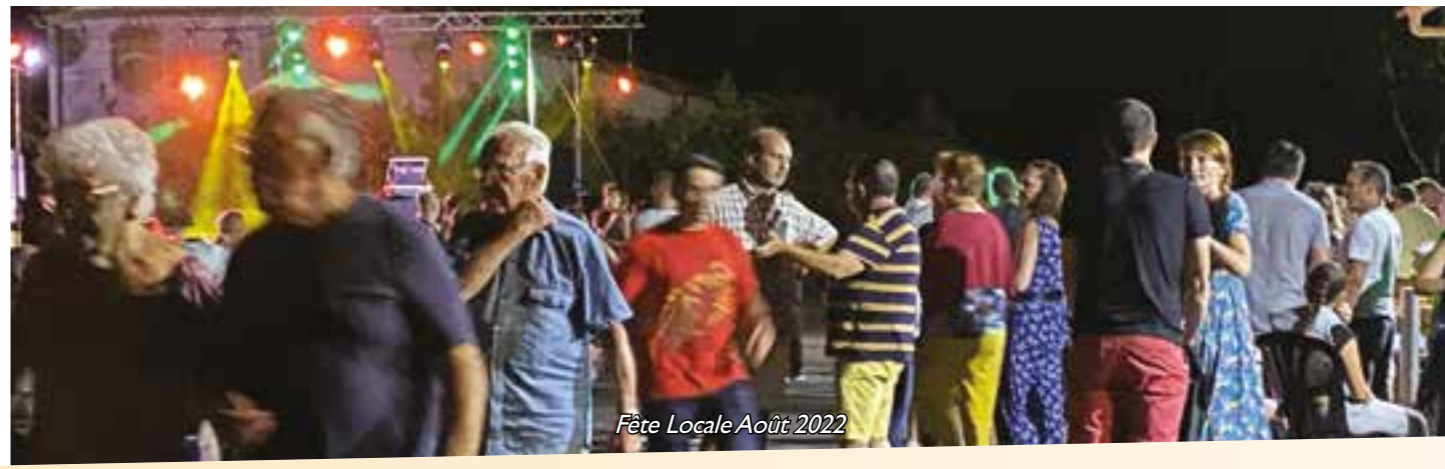
Fête Locale Août 2022