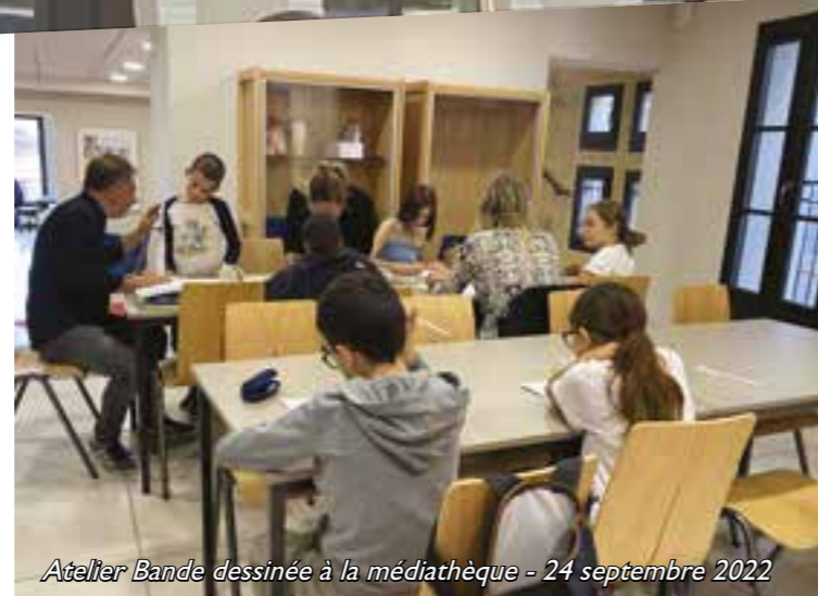
Atelier Bande dessinée à la médiathèque - 24 septembre 2022