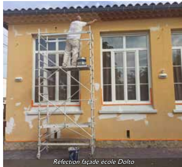
Réfection façade école Dolto