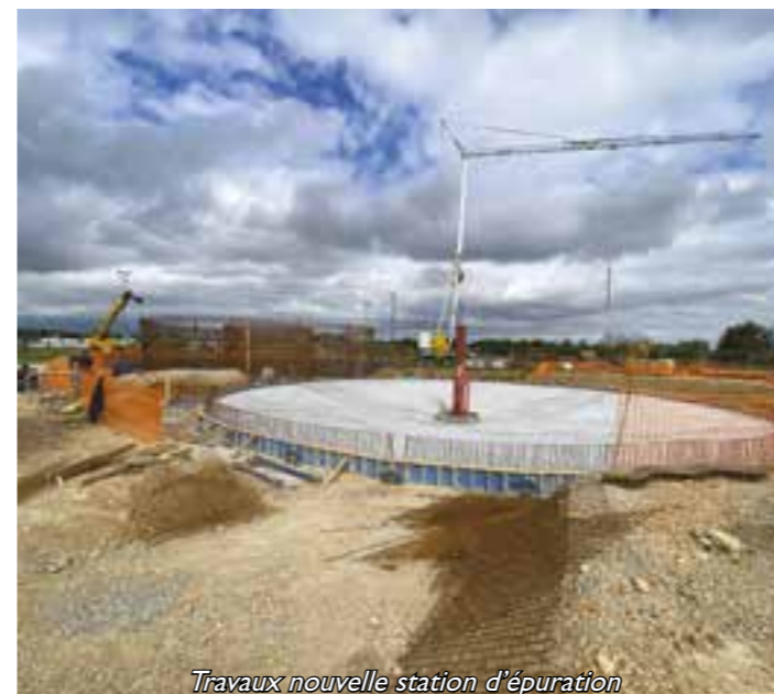
Travaux nouvelle station d'épuration