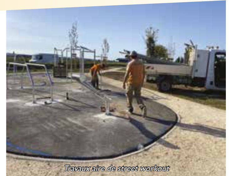
Travaux aire de street workout