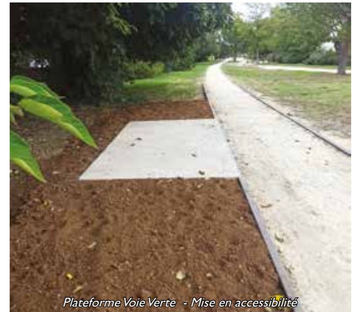
Plateforme Voie Verte - Mise en accessibilité