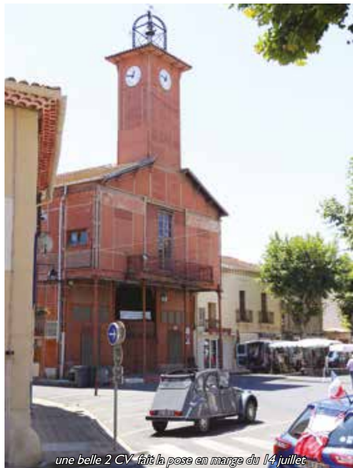
une belle 2 CV fait la pose en marge du 14 juillet