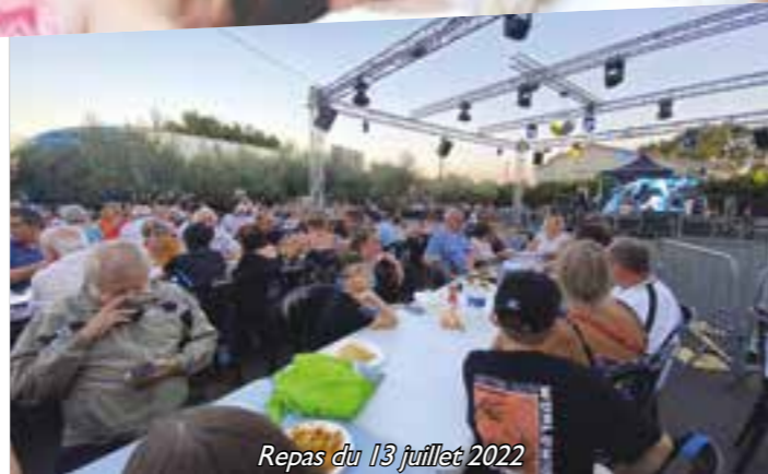
Repas du 13 juillet 2022