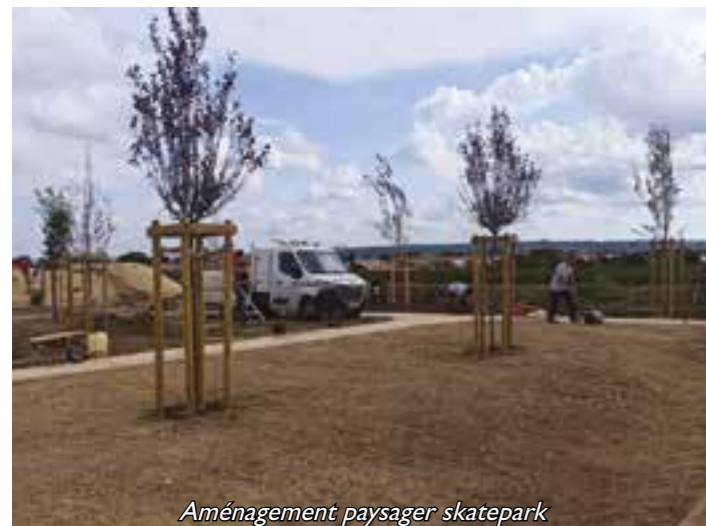
Aménagement paysager skatepark