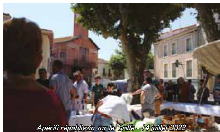
Apéritif républicain sur le Griffé - 14 juillet 2022