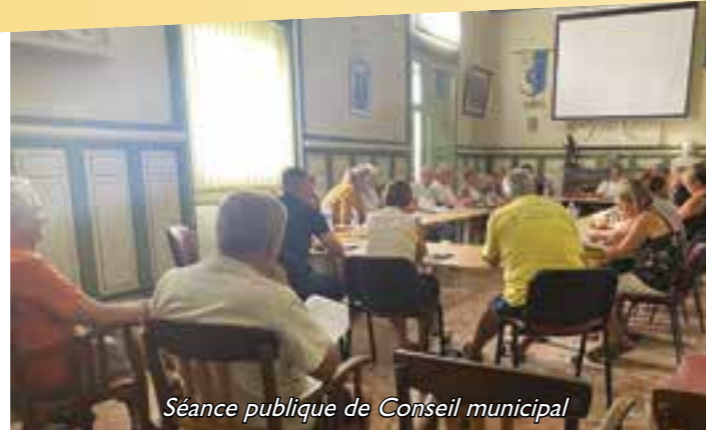
Séance publique de Conseil municipal

Les festivités qui nous avaient tant manqué ces 2 dernières années ont repris avec un grand succès. Paulhan bouge, se transforme en conservant son visage humain et rural. Cela se réalise grâce à notre implication quotidienne, celle des services administratifs, culturels et techniques. Actions auxquelles s'ajoute celle de la police municipale pour la tranquillité publique qui est un défi de taille. Les bénévoles des associations participent activement à ce renouveau post covid en inventant des stratégies et des actions pour remplir leur rôle de tisseur du milieu social. Toutes ces initiatives conjuguées créent une dynamique incontestable. Notre implication pour le soutien au développement économique se concrétise par l'obtention de la possibilité d'agrandir la zone de la Barthe de commercialiser 4 hectares avant le vote du SCOT (Schéma de cohérence territoriale dont dépend notre PLU) au niveau du Pays Cœur d'Hérault, ce qui va créer des emplois nouveaux sur la commune.