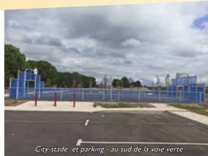
City-stade et parking - au sud de la voie verte