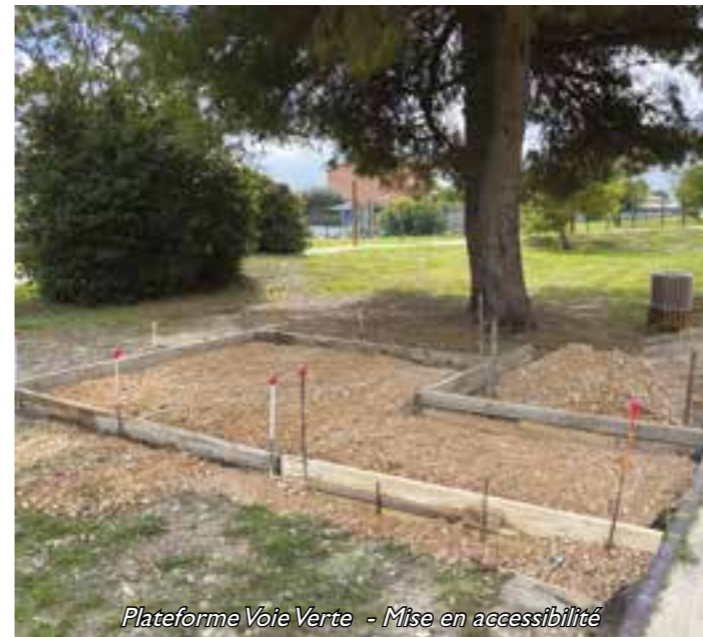
Plateforme Voie Verte - Mise en accessibilité