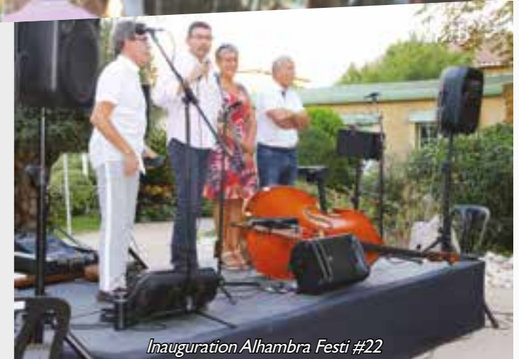
Inauguration Alhambra Festi #22