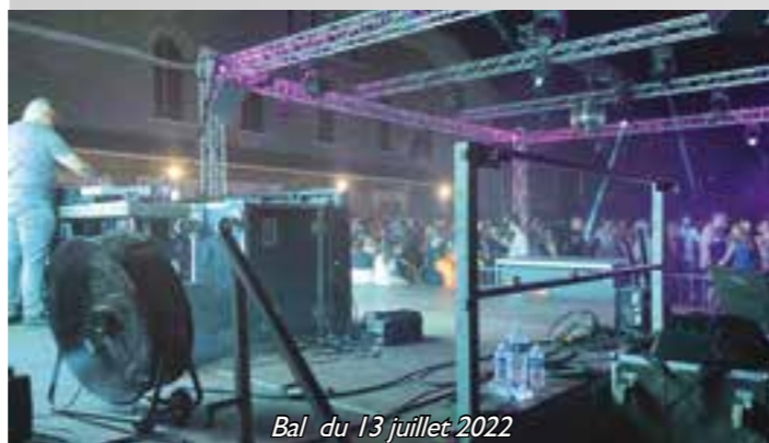
Bal du 13 juillet 2022