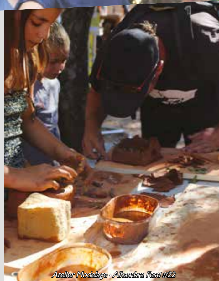
Atelier Modelage - Alhambra Festi #22