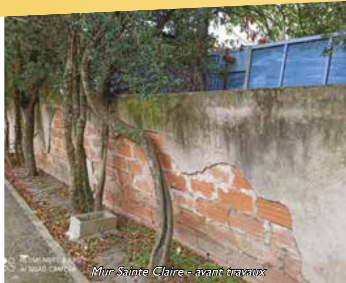
Mur Sainte Claire - avant travaux

effectués en régie municipale, par des entreprises ou par le chantier d'insertion (gare).