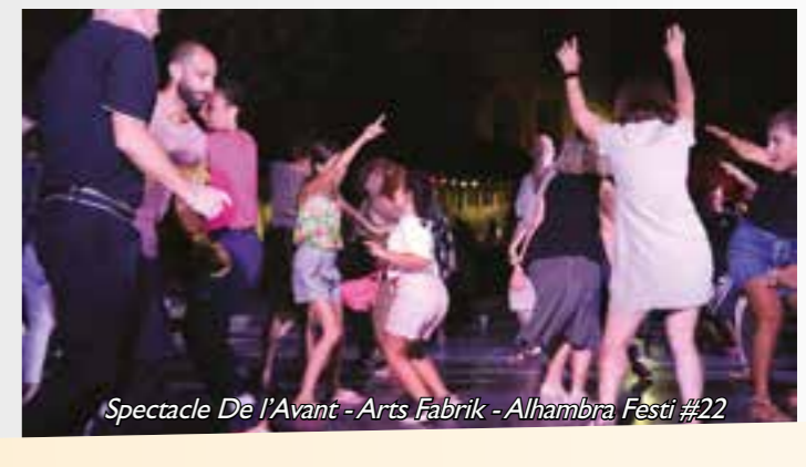
Spectacle De l'Avant - Arts Fabrik - Alhambra Festi #22