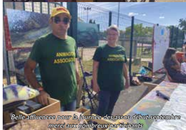
Belle affluence pour la journée des assos début septembre merci aux nombreux participants