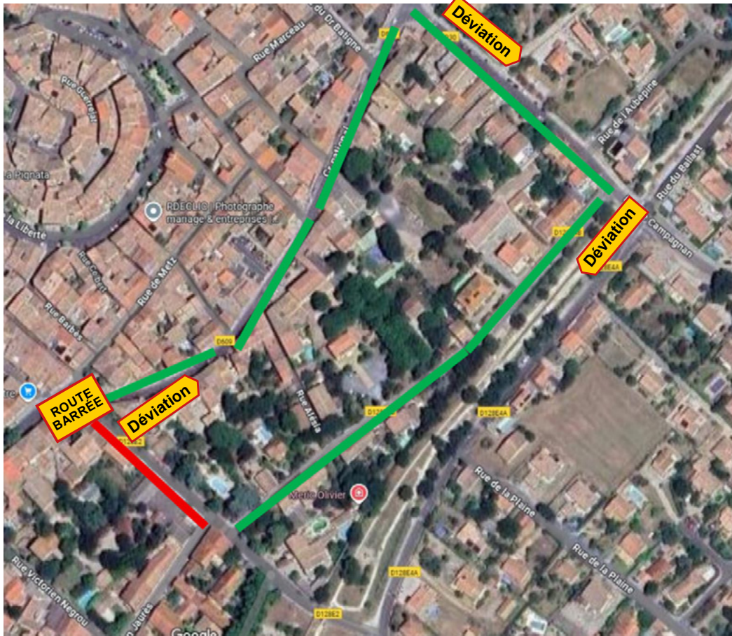
Figure 2 : Rue Raspail (déviation dans un second temps)